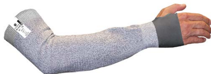
81-4121/CK - Fermeture élastique pour empêcher la manchette de descendre