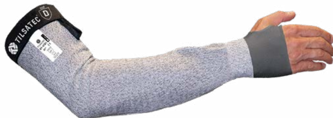
81-4121/CV - Fermeture par sangle de réglage à fixation auto-agrippante